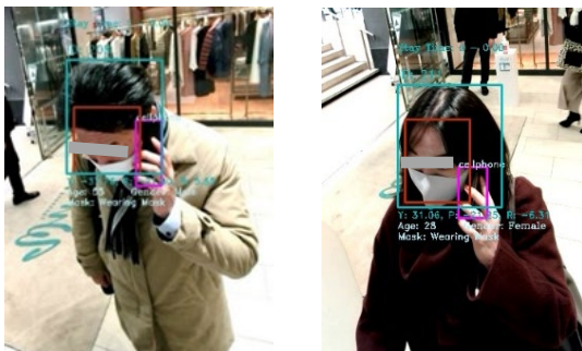
(AI 画像分析イメージ)

今後、一部 ATM において、携帯電話の通話動作を検知した場合には、速やかに警告表示や警告音で利用者に知らせるなど、特殊詐欺の被害防止に向けた実証実験を行います。